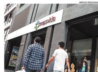
MASVIDA TENDRÁ UN NUEVO CONTROLADOR.

noritarios, los términos y condiciones para la mantención del Plan Médico Socio, que garantizará la vigencia de los actuales beneficios de dicho plan, y el porcentaje y monto de la inversión por parte de Southern Cross Group, considera la adquisición del 55% de la propiedad del Grupo de Empresas Masvida. es